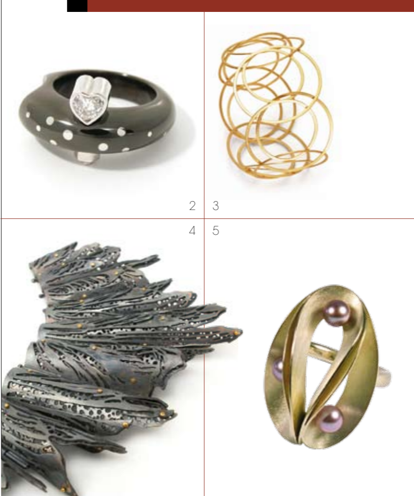
2 3 4 5